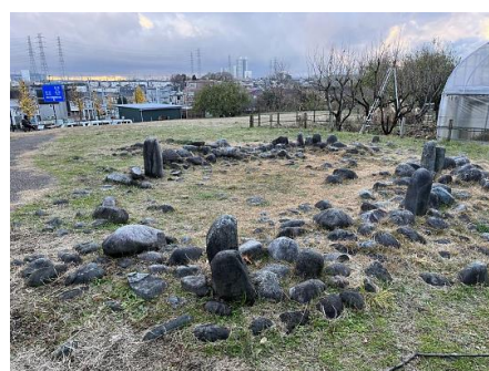
田端環状積石遺構 (2022/12/22 撮影 武田)