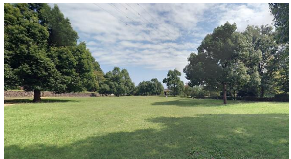
小山内裏公園内 芝生広場(Google Map)