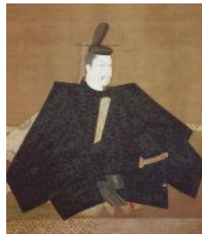
絹本着色伝源頼朝像