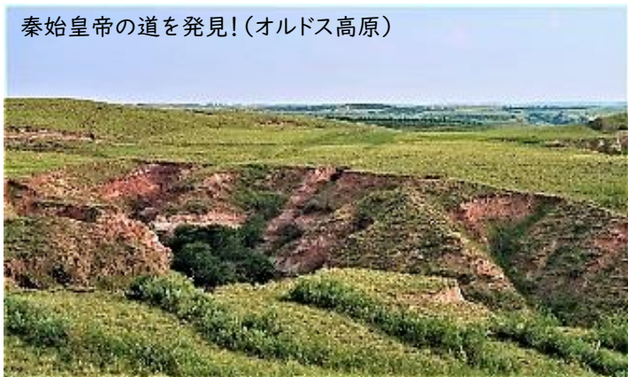
秦始皇帝の道を発見！（オルドス高原）