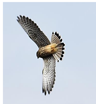
チョウゲンボウは「稲城市の鳥」

昨年に引き続き、新春初のウォーキングは「多摩よこやまの道」東端の高台から始めます。