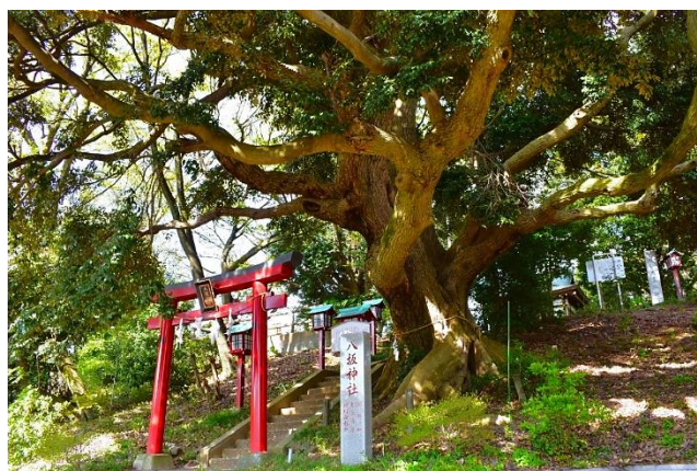
天王森のスダジイ

ガイドでは、明治15年～17年にスポットを当て、近代以降の変貌著しいこの地域の動きを振り返ります。