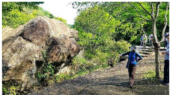
鎌倉城砦で当時目印となった？獅子岩