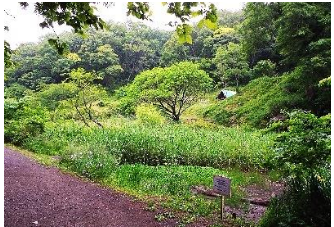
鎌倉城が眠る？中央公園一帯