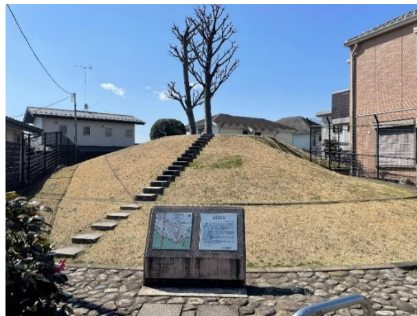
住宅地内に残る高倉塚古墳