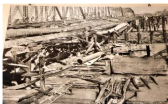
関東大震災で壊れた橋

震災後に架けられた美し き復興橋たちを、あらため て、“土木大好き! ドボタスキー”の 視点で眺めてみよう!