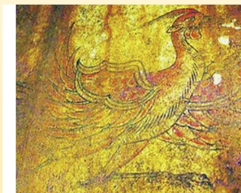
キトラ古墳朱雀図

知れば知るほど奥が深い、アスカ（飛鳥）文化だからこそその国造りの技、そして天香久山や飛鳥の中心地「真神原（マガミハラ）」、キトラとミナミウラ地名に秘められた意外な歴史の真相…。各地を長年にわたり実地踏査し、NHKのテレビ&ラジオ番組でも紹介してきた、明日香と関東の深いつながりをご紹介します。